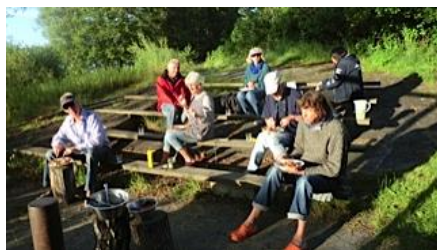
Grillfest i solnedgången

Efter ett par timmars segling med god vind angjorde vi en bergknalle i lite skyddat läge. Angöringen var inte helt okomplicerad och inte heller ilandstigningen. Men allt gick bra och vi åt, fikade och hade det trivsamt och bra. Väl hemkomna var det rast, vila bastu och dopp i "havet", samt förberedning av kvällens grillning. Efteråt kunde vi "kura skymning" i den nedåtgående solens vackra färger.