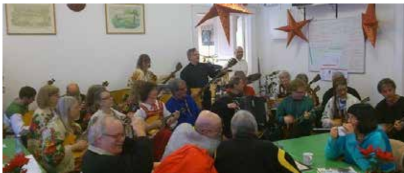
Södra Bergens Balalajkor Västberga 6 /1 2013

Ny gemenskap har under alla år inte bara serverat måltider till utsatta individer. Att mätta kulturella behov har varit en naturlig del av Ny Gemenskaps vision.