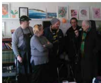
”Chef United” avtackas