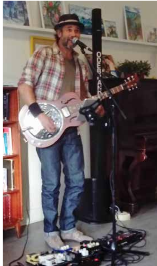
Odebrand spelar på Västberga

I den tid vi nu lever i där vi kommunicerar med Emojis och korta textmeddelanden och där personliga relationer swipas till vänster behövs fler människor som bryr sig om varandra och som har tid att samtala, lyssna och bryr sig som Ny Gemenskap gör varje dag, året om.