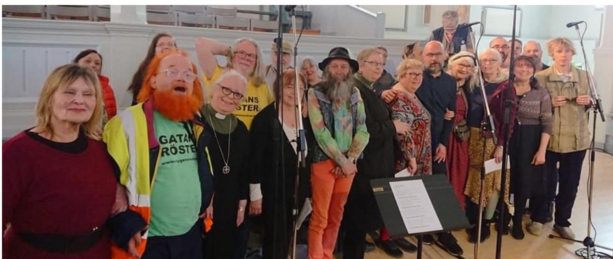
Gatans Röster sjunger på radiogudstjänst från Andreaskyrkan