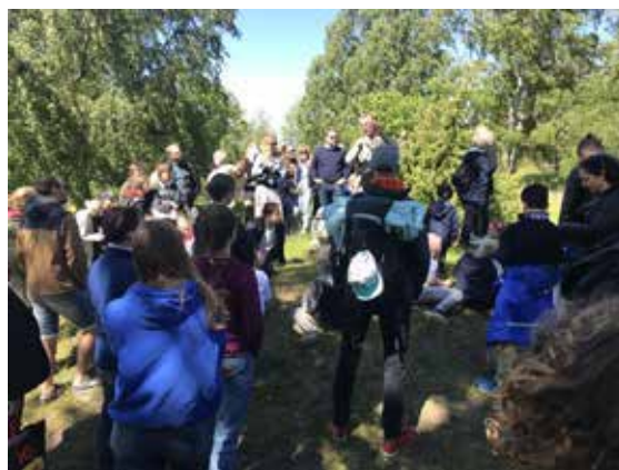
Utfärd till Birka

Till Stadsmuseet, Historiska museet, Drottningholms slott, Vaxholms fästning, Medeltidsmuseet, Birka. Vasamuseet, Armémuseet, Nordiska museet, Hallwylska museet, Fotografiska, Stadshuset, resa till Dalarna, Ersta diakonisällskaps skärgårdshus, Sala silvergruva, Gripsholms slott, Frälsningsarmén i Strängnäs, Kurön samt hockeymatch med Tre Kronor. Vid dessa tillfällen har vi även ätit tillsammans och många gäster har gjort sig nya vänner och bekanta.