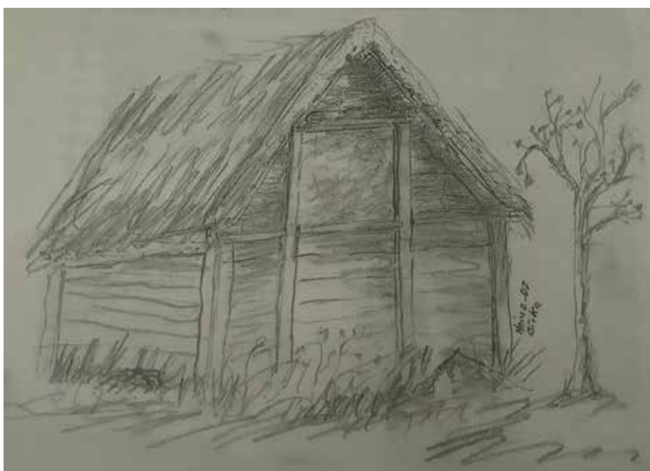
Teckning av Heintz Siwerth: Gammal stuga

"Calle" berättade om sitt liv - Uno skrev