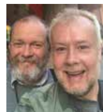
Jonas o Damon